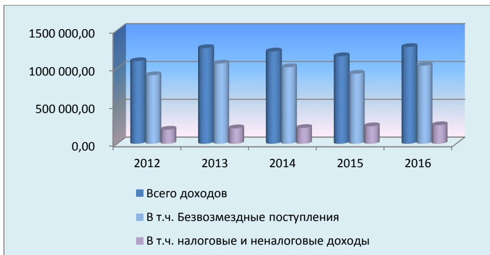
Динамика поступления доходов в консолидированный бюджет Рыбинского муниципального района

Рост налоговых и неналоговых доходов консолидированного бюджета Рыбинского муниципального района в 2013-2016 г. г. связан с увеличением налоговой базы по НДФЛ и земельному налогу. Налоговые и неналоговые доходы бюджета по сравнению с 2015 годом выросли на 6% и составили 246,2 млн. руб.